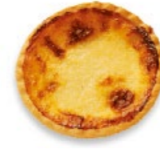
Ramequin Party précuit Ø 6 cm env. Tortina al formaggio Party precotta Ø ca. 6 cm