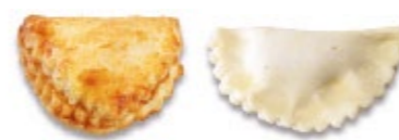
Beignet de tomate Apéro pâton, badigeonné à l'œuf Fagottino al pomodoro Aperitivo crudo, pennellato con l'uovo