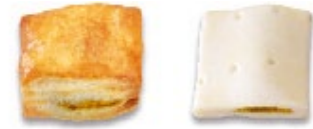
Coussinet de curry Apéro pâton, badigeonné à l'œuf Salatino al curry Aperitivo crudo, pennellato con l'uovo