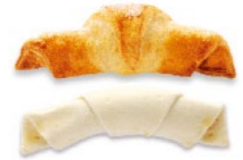
Croissant au jambon Party pâton badigeonné à l'œuf Cornetto al prosciutto Party crudo pennellato con l'uovo