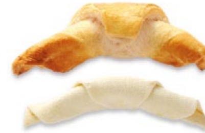
Croissant au jambon Apéro pâton badigeonné à l'œuf Cornetto al prosciutto crudo pennellato con l'uovo