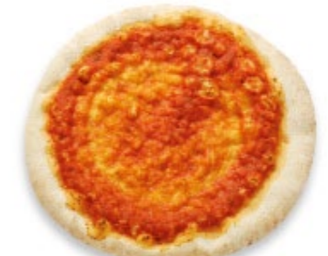
Pizza base précuite fond de pizza avec sauce de tomate, Ø 25 cm env. Pizza base precotta con salsa di pomodoro, ca. Ø 25 cm