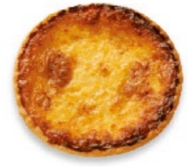
Ramequin précuit Ø 9 cm env. Tortina al formaggio precotta Ø ca. 9 cm