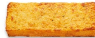
Pain à l'ail précuit Pane all'aglio precotta