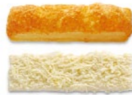
Bâtonnet au fromage Apéro pâton Bastoncino al formaggio Aperitivo crudo