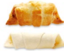
Croissant au jambon Apéro pâton badigeonné à l'œuf Cornetto al prosciutto Aperitivo crudo pennellato con l'uovo