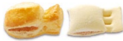
Roulette à la viande Apéro pâton badigeonné à l'œuf Avvoltino di carne Aperitivo crudo pennellato con l'uovo