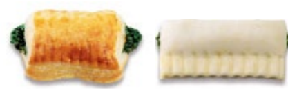
Pochette aux épinards Apéro pâton, badigeonné à l'œuf Fagottino agli spinaci Aperitivo crudo, pennellato con l'uovo